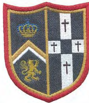
Feinste Details, realisiert mit dem Garn „Polyneon 75“

Anhand der gelben Hülsenfarbe erkennt man die Garnsorte auf der Stickmaschine sofort